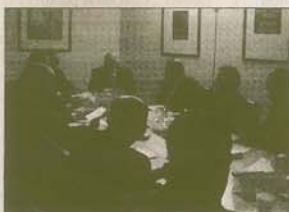
El grupo de asistentes en un momento de la tertulia.

Los incesantes cambios producidos, así como las consecuentes tensiones que de ellos se derivan, han convertido al sector energético en un campo muy propicio para resolver los conflictos existentes de forma extrajudicial, a través de instituciones como la Mediación y el Arbitraje. Cuestiones como el porcentaje de incremento de las tarifas y la propia asunción de un déficit tarifario, la repulsa o la apuesta decidida por la energía nuclear, la integración de gas y electricidad, el esquema retributivo de las energías renovables, los movimientos corporativos o la seguridad de las inversiones transfronterizas, son asuntos que reflejan la existencia de posiciones encontradas y conflictos soterrados que es preciso clarificar cuanto antes; y es en este punto donde el Arbitraje —impulsado por la Ley que entró en vigor en 2004— se presenta como una eficaz herramienta alternativa.